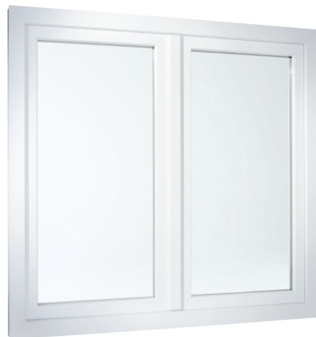
2-flügeliges Fenster in flächenversetzter Variante