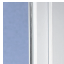
Klassisches Design mit weicher Kontur

Mit modernen Kunststofffenstern aus VEKA Profilen gewinnt jedes Haus. Denn das klassische Design des SOFTLINE Systems mit der leicht abgerundeten Kontur ist zeitlos und harmonisiert hervorragend mit unterschiedlichsten Architekturstilen – ob modern oder traditionell, ob Neubau oder Renovierung.